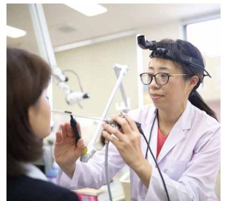
「安心感がある」と幅広い年齢層に人気の女性医師