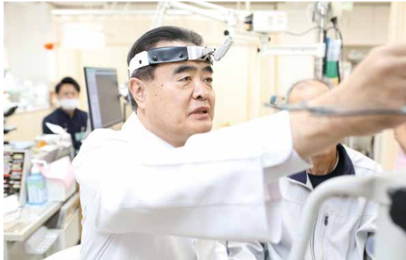
経験豊富な宮村会長の診察と人柄に惹かれる患者が多い

中でも小児の耳鼻科疾患の早期発見・治療には定評があり、遠方から受診する人も。子どもは免疫機能が未熟なため感染症にかかりや