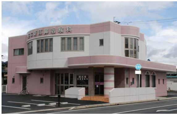
熊本市東部地区に密着した安心・安全の医療を提供する

すく、重症化することも珍しくな い。特に乳幼児の中耳炎は長引く と言葉の発達に影響を及ぼすと あって、早急な診断と治療が求め られる。その点、同院では高い医療 技術はもちろん、子育て経験のあ る女性医師や看護師が常駐し、子 どもに寄り添った治療を提供。キッ ズルームや授乳室を完備するなど、 親子で安心して通える環境も整っ ている。頼れる地域の耳鼻・のど の専門家。0歳児から高齢者まで、 気軽に受診できるのが同院の魅力 である。